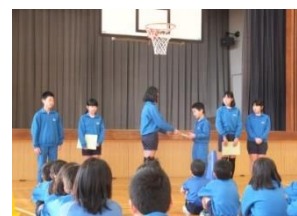
児童朝会 5 年生への委員長の引継

まず、学習面で頑張りたいとは、みんなが協力して取り組むことです。分からないことは友達や先生に聞いて取り組んでいきたいです。そして、友達が困っていることがあったら、助けあつていきたいです。 次に、生活面では、あいさつがあまりできていなかったから大きな声ではつきりどけるようにしたいです。掃除では、何も作業がない人はどうすればいいかを教えていきたいと思います。下の学年のみんなを引張り、みんなが協力してやりたいです。